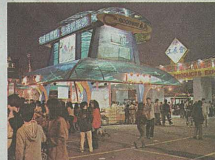
歷史年份也是難記的東西，如香港第一屆工展會在哪年舉行？

例子：香港第一屆工展會在哪年舉行？ 答案：1938年。 參考方法：首先這件事情在二十世紀發生，年份的開頭一定是「19」。工展會小姐是工展會的一大特色，而在芸芸節日中，尤以三八婦女節最為代表女性，所以便是「38」年了。