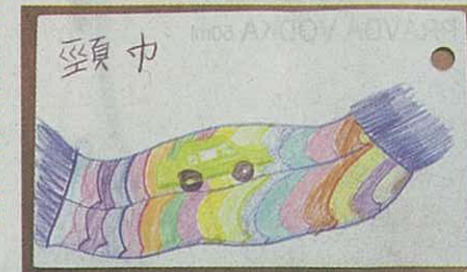
另一面運用想像力，畫上與該英文生字扯上關係的圖畫。